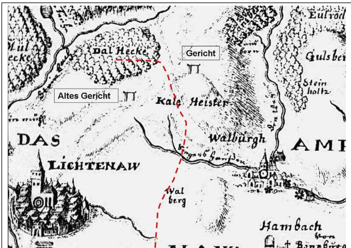
Abb. 3, Auszug Schleenstein-Karte von 1708, eindeutige ist die Lage des Galgens zu den damaligen Verkehrswegen zu erkennen. Als Rekonstruktion wurde die ungefähre Lage der Gemarkungsgrenze Lichtenau – Walburg und der Galgen am „Alte Gericht“ eingezeichnet. Quelle: Schleenstein'sche Karte 1705 – 1715, Blatt 7 (1708), Reproduktion Hess. Landesamt für Bodenmanagement und Geoinformation

Fehlende, bzw. verloren gegangene Schriftquellen sind nicht mehr zu beschaffen, aber es stehen uns die alten und neuen Flurnamen als derzeit einzige Quelle für eine ungefähre Standortbestimmung der Richtstätte zu Verfügung, auch wenn diese Galgen- und Gerichts-Flurnamen erst ab dem 17. Jahrhundert in den Quellen vorkommen.