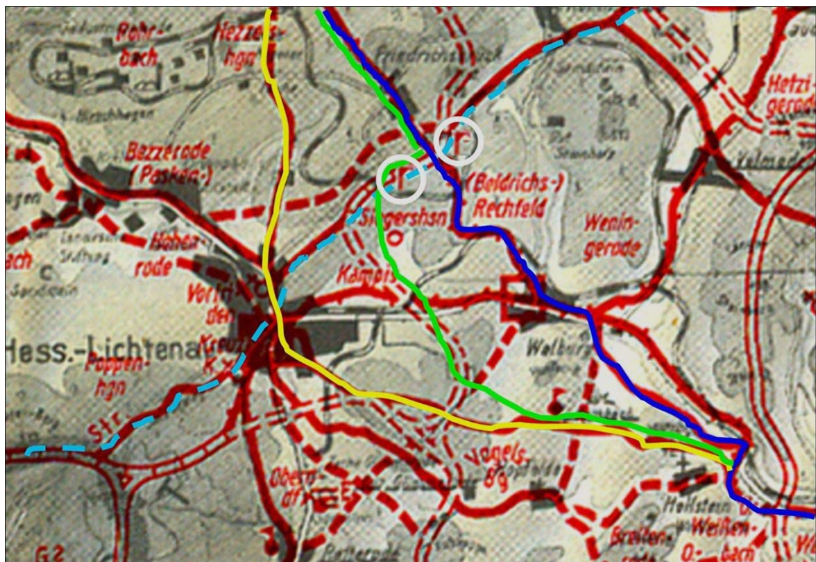
Abb. 4. Rekonstruktionsversuch des Verlaufes der Leipziger Straße (Roland Gernand).

Im Walburger Kataster von 1780 (siehe Abb. 1) sind die Flurnamen „Vor dem Galgenberg“, Hinter dem Galgenberg“, „Unter dem Galgenrain“, „Der Galgenrain“, „Der Galgen“, „das Gericht“ und „vorm Gericht“ überliefert. Die älteste Flurnamenquelle stammt aus dem Jahr 1664. Dort heißt es: „... Das Alte felt genant beym Gericht ahn der Helßer straßen gelegen...“ (Helßer straßen = Straße nach Helsa, also die Leipziger Straße). 14 Diese Flurnamen befinden sich alle im Grenzbereich der Gemarkung Walburg und Hessisch Lichtenau um den Kopf des Eisenberges, sowie im Kreuzungsbereich der alten Leipziger Straße und Sälzerstraße (siehe Abb. 2). 15 Wichtig für die engere Eingrenzung sind die fehlenden Flurnamenhinweise mit Bezug auf Galgen oder Gericht in den Walburg Grenzbeschreibungen von 1436 und 1484, was ein Indiz dafür ist, dass es zu diesem Zeitpunkt noch kein Galgen an der Gemarkungsgrenze gab. 16