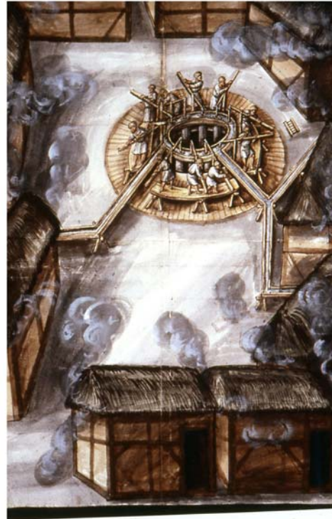
Abb. 2: Soleschöpfen mit Pumpen

Anderthalb Jahre später, durch den ersten Pachtvertrag vom 23. Dezember 1540 62 , übernahm Landgraf Philipp dann das ganze Salzwerk in eigene Regie, und das war der Beginn einer ganz neuen Ära.