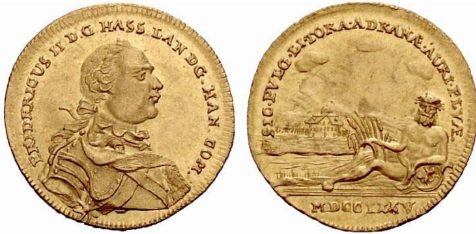
Abb 4: Hessen-Kassel, Friedrich II, Edergold-Dukat 1775, UBS AG Gold & Numismatik, Zürich

Im Zusammenhang mit der Frankenger Medaille entstanden die von Körner geschnittenen Stempel für die Flussgolddukat von 1776, deren Gold mühsam aus der Eder zwischen Fritzlar und Felsberg gewaschen wurde, die von Miniaturmedaillen zu 1/32 Dukaten (0,12 g) begleitet waren, für die es schon 1775 Probeabschläge in Silber von anderem Stempel gegeben hatte. 30 Im Herbst 1776 waren die Stempel mit der Rückseiteninschrift SIC FVLG(ent). LITORA. ADRANAE. AURI. FLUAE = so glänzen die Ufer des Gold führenden Ederflusses fertig. Nach der Vorlage von Probeabschlägen sollte der Mund des landgräflichen Porträts korrigiert werden. Es wurde festgestellt, dass es besser gelungen war als das der Ausbeutemedailien. Korrekturen waren bei noch ungehärteten Eisenstempeln möglich, so dass Körner sich um eine Korrektur bemühte. 31