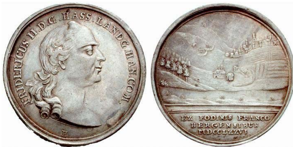
Abb. 1: Hessen-Kassel, Friedrich II. (1760-1785), Frankenberger Ausbeutemedaille 1776, UBS AG Gold & Numismatik, Zürich

Die Prägung der auch Reichsspeziestaler genannten Taler nach den Reichsmünzgesetzen des 16. Jahrhunderts war schon längst nicht mehr rentabel. Dennoch prägten die Welfenherzöge ihre Harzer Ausbeutetaler weiterhin im alten Fuß von neun Talern aus der feinen Mark. 17 Auch die 1754 bis 1759 geprägten Taler Landgraf Wilhelms VIII. von Hessen-Kassel (1751-1760) als Graf von Hanau-Münzenberg waren noch Reichsspeziestaler nach den Reichsmünzgesetzen. Die jüngeren Bieberer Ausbeutetaler sind dann Konventionstaler. 18 Bei Anwendung des Reichsfußes hätte das Silber aus Frankenberg 918 Speziestaler ergeben, nach dem Konventionsfuß immerhin 1.020 Konventionstaler.