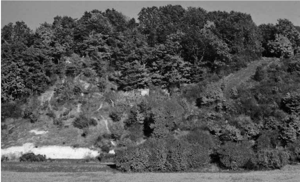
Abb. 4: Ansicht der Lage am Oberaspher »Hammelsberg« von Westen, September 1992

Dieser ehemalige Prallhang der Asphe ist ein teilweise als Sandbruch genutzter Aufschluß im oberen Bereich des Zechsteins, in geringer Entfernung steht bereits Buntsandstein an. Der Boden der Rebanlage besteht aus skelettreichem, stark sandig-kiesigem Lehm und hat eine Mächtigkeit von etwa 70 cm bei den ersten und bis über einen Meter über dem Festgestein bei den später gesetzten Stöcken.