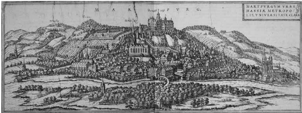
Abb. 1: Ansicht von Marburg mit Weingärten aus dem Jahr 1572; der »Weinberg« befindet sich hinter dem Schloßberg rechts [ http://www.lagis-hessen.de/de/subjects/idrec/sn/oa/id/2495 ] (Stand: 15.1.2014)]