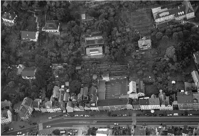
Abb. 2: Luftaufnahme des Weingartens im ehemaligen Weinbaugelände des Deutschen Ordens in Marburg, August 2014

ist sehr steil und schwer zugänglich, der Weingarten nur über Fußwege erreichbar. Es handelt sich um eine alt terrassierte Südlage auf etwa 220 Meter über Normalnull. Der Buntsandsteinverwitterungsboden ist überwiegend flachgründig, zum Teil durch Auffüllungen mittel- bis tiefgründig und besteht aus schwach humosem Sand mit geringer Wasserspeicherkapazität.